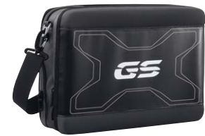
5 Innentasche für Vario-Gepäcksystem