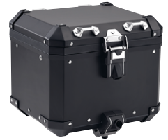
3 Aluminium-Topcase schwarz