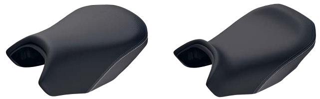
11 Fahrersitz Exclusive hoch und niedrig