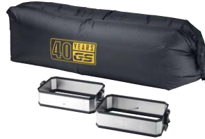
4 Volumenerweiterung silber