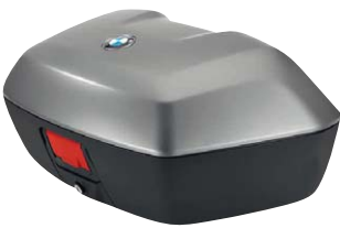
6 Topcase groß, 49 l