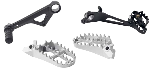
9 Fußhebel einstellbar schwarz und Fußrasten Enduro