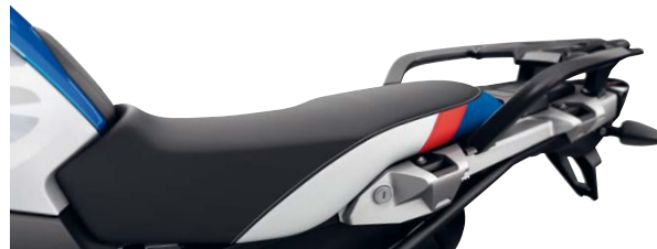
13 Rallye-Sitzbank niedrig mit Gepäckplatte