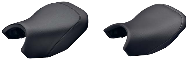
10 Fahrersitz Komfort hoch und niedrig