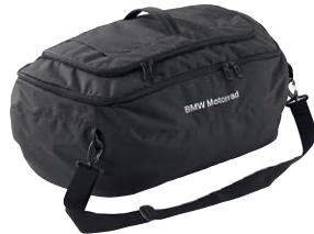
7 Innentasche für Topcase groß