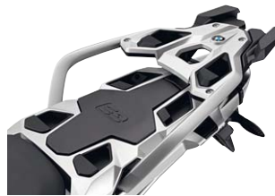
8 Gepäckplatte Soziussitz