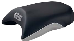
12 Soziussitz Exclusive