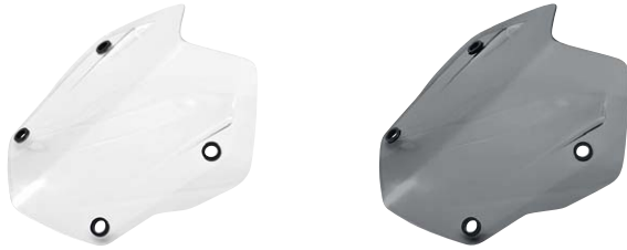
8 Windschild Rallye klar oder getönt