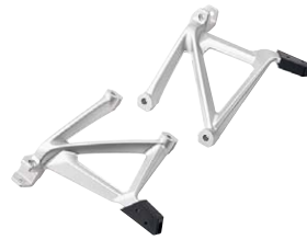
4 Kofferhalter silber