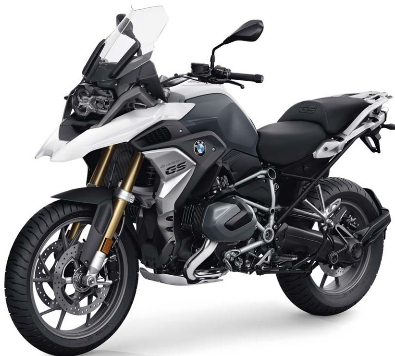
BMW R 1250 GS Fahrzeugpreis

BMW R 1250 GS Fahrzeugschlüssel-Nr. 0M01