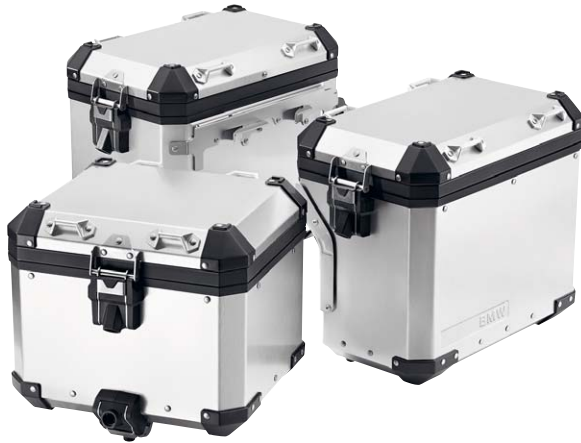
1 Aluminium-Gepäcksystem silber