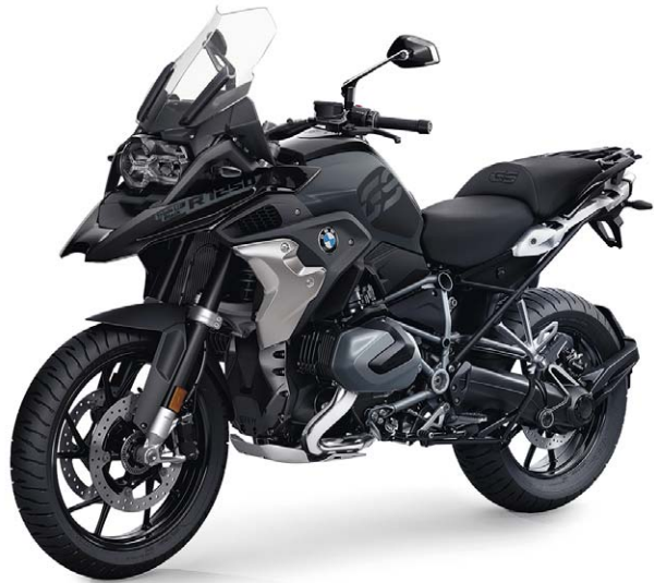
BMW R 1250 GS Rallye inkl. SA-Nr. 453