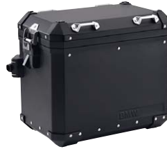
2 Aluminium-Koffer schwarz