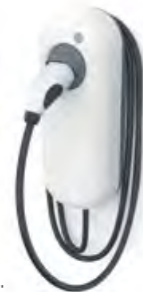
OPTIONAL: SMART PARTNER WALLBOX 3 .