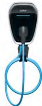
OPTIONAL: BMW WALLBOX.