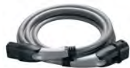
SERIENMÄSSIG: BMW CHARGING CARD 4 UND LADEKABEL (MODE 3).

Um Ihre persönliche BMW Charging Card 4 zu aktivieren, registrieren Sie sich einfach mit Ihrer BMW ID und Ihrer Fahrzeugidentifikationsnummer auf bmw-charging.com oder auch bequem über die My BMW App 2 . An der Ladestation angekommen, identifizieren Sie sich wahlweise mit der BMW Charging Card 4 oder der My BMW App 2 . Im Rahmen der monatlichen Rechnungsstellung erhalten Sie eine Gesamtübersicht über die Kosten aller öffentlichen Ladevorgänge. Ihre Rechnung erhalten Sie nach Wunsch per Online-Portal, E-Mail oder auf dem Postweg.