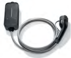
SERIENMÄSSIG: FLEXIBLE FAST CHARGER.